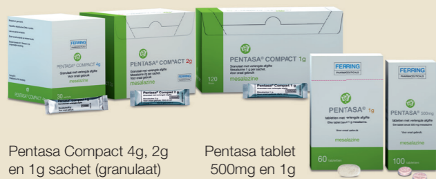
Pentasa Compact 4g, 2g en 1g sachet (granulaat)