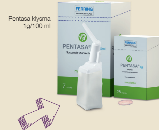
Pentasa klysma 1g/100 ml